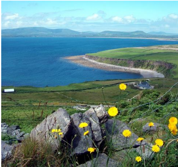
Die malerische Küste von Donegal

einem Glas Stout den herrlichen Panoramablick über Dublin. Übernachtung im Hotel Green Isle bei Dublin.