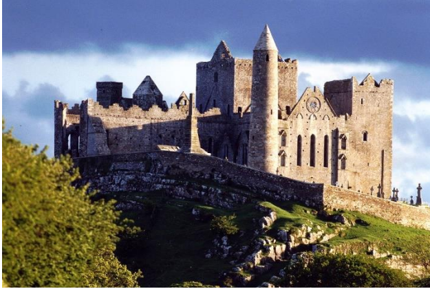
Rock of Cashel

Der berühmte Rock of Cashel war einst der herrschaftliche Sitz keltischer Könige, später ein wichtiges Kirchenzentrum. Heute wird er oft die Akropolis Irlands genannt. Majestätisch ragen die alten Kirchengemäuer von dem Felsbrocken in den Himmel. Anschließend geht es zurück in die Hauptstadt. Abendessen und Übernachtung Carlton Hotel Blanchardstown bei Dublin (320 km).