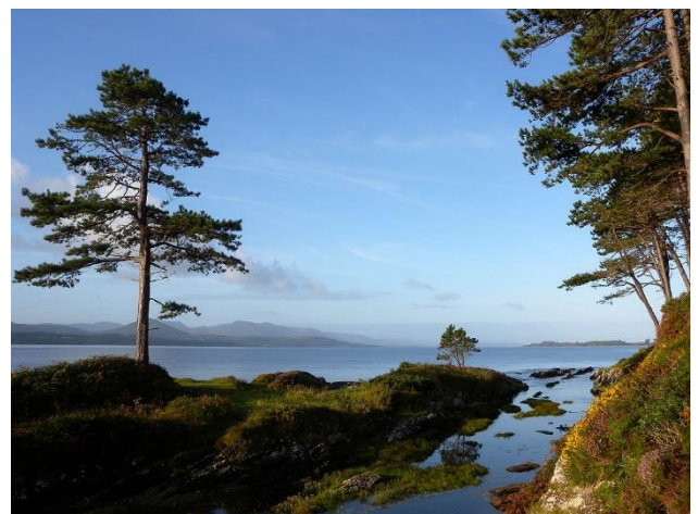
Ring of Kerry - traumhaft schöne Landschaft

Der Ring of Kerry ist eine 170km lange Panorama-Fahrt um die Iveragh Halbinsel. Die felsige Küstenlinie im Südwesten von Irland steht im krassen Gegensatz zu der mannigfaltigen Vegetation, die durch den Einfluss des Golfstromes hervorgerufen wird. Die Reiseroute führt durch viele kleine Dörfer und über die Berge nach Moll's Gap und Ladies' View , zwei hervorragende Aussichtspunkte, die einen wunderbaren Blick über die Killarney Seen bieten. Ferner besichtigen wir im Killarney National Park das Muckross House , eines der führenden Herrenhäuser Irlands. Die Gärten um Muckross House sind weltweit bekannt für ihre Schönheit, insbesondere für ihre Azaleen und Rhododendren; der Steingarten ist stolz auf einen ausgedehnten Wassergarten und wurde aus natürlichem Kalkstein geschaffen. Das Franziskanerkloster Muckross Friary wurde im 15. Jahrhundert gegründet, dessen Kreuzgang und die angrenzenden Gebäude sind vollständig erhalten. Anschließend geht es zurück ins Inisfallen Hotel in der Grafschaft Kerry.