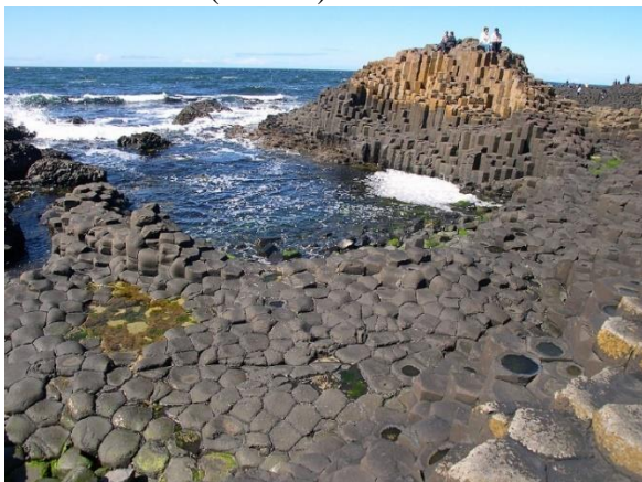
Giants Causeway mit den Basaltformationen

Übernachtung im Corrs Corner Hotel in der Grafschaft Antrim. (175 km)