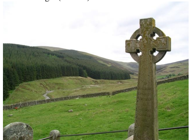
Keltische Kreuze im ganzen Land

Übernachtung im Mount Errigal Hotel in der Grafschaft Donegal (197 km).