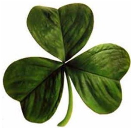
Shamrock, National-symbol der Iren

Eine Reise auf die grüne Insel Irland, dem Land der Kelten, ist für Bewohner Villingens ein besonderes Erlebnis. Schließlich ist man in der Heimat stolz auf das keltische Fürstengrab auf dem Magdalenenberg und die Funde im Franziskanermuseum, die durch den „Keltenpfad“ verbunden sind. Irland oder Éire ist der einzige souveräne Staat Europas, in dem Keltisch bzw. Gaelic offizielle Staatssprache ist.